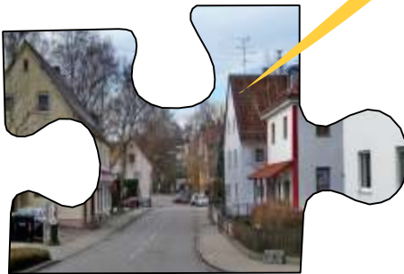
Projekt „Ganghoferstr./ Bahnhofstr./Uzstraße“

Der ehemalige Burgstall Weldens war lange Zeit ein herausragendes Wahrzeichen des Ortes. Aktuell ist der Burgberg mit seiner Historie nicht erkennbar. In Zukunft sollen die geschichtliche Bedeutung und die vorhandenen historischen Strukturen erlebbar gemacht werden.